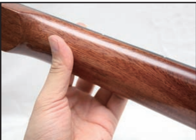
↑ネックの裏もこのとおり。この写真からだ、普通のギターを後ろから撮った写真にしか見えないな~