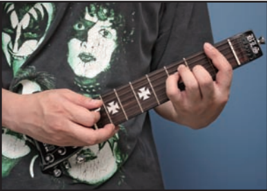
↑ちなみに、これが正しい弾き方です。通常のヘッド部を右手側に持ってきてピッキングします