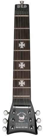
Zakk Wylde Black Label Society ¥9,975

シュレッド・ネックにはカラフルなモデルがよく似合う。ということで、オススメしたいのが、このザック・ワイルド・モデルだ。ザックおなじみのサークル・フィニッシュをはじめ、カモフラージュ・モデルなどファンにはたまらないフィニッシュ。さらに、メイプル指版もあるぞ!