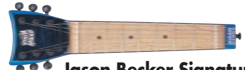
Jason Becker Signature ¥10,290

筋萎縮性側索硬化症の闘病生活を続けている元カコフォニー〜デイヴ・リー・ロス・バンドのジェイソン・ベッカー・モデルもあります。売り上げの一部は彼の治療の為に寄付されるとのこと。