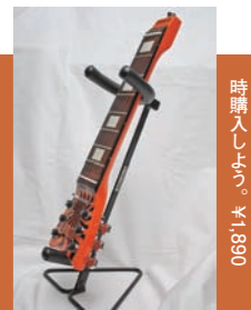
↑専用のスタンドが、これもまたキュートだ。ぜひ、同購入しよう。¥1,890

のためかと思ったら、ピッキングする時に指版に当たらないようにとのことらしい。うーん、細かい気配りだ。でも、たしかに、ウォーミング・アップ用のフィンギリング練習には最適だ。チューニングはできないので、音の確認はあきらめて、指慣らしという意味では場所も取らないし、便利なアイテムである。ただ、何よりも、楽器店で目にしたら、思わず衝動買いしたくなってしまおうモデルである。部屋のインテリアとして、ぜひ飾っておきたい1本だ。