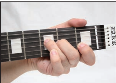
↑基本的な感触は、ギターネックそのもの。弾き心地は、やや幅広いタイプのネックの感じだ

前ページでネックだけのギター&ベースを紹介しているが、さらにさらにおもしろい楽器が、ここに紹介するシュレッド・ネックだ。今度はネックだけどころじゃなく、ネックを途中からぶった切った形状で、音は鳴らず、さらに基本的にはチューニングもできないという潔さ。こんな愉快な楽器は、見たことないぞ!