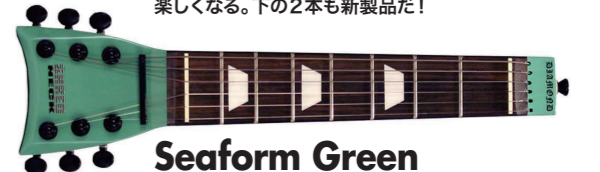
Seaform Green ¥8,925

どハテナものからシブいものまで様々なフィニッシュがあるシュレッド・ネック。アーティスト・モデル以外にも、ジャンジャン新製品が登場しているから楽しくなる。下の2本も新製品だ!