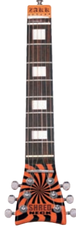
Zakk Wylde Buzz Saw ¥9,975