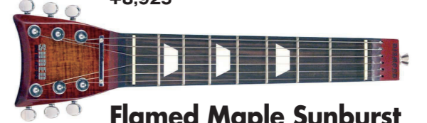
Flamed Maple Sunburst ¥9,975