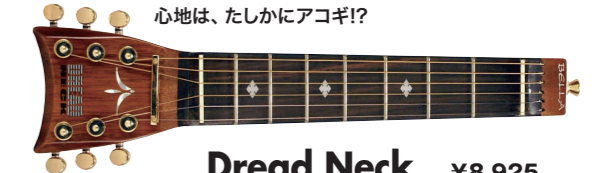
Dread Neck ¥8,925

さらに、アコースティック・タイプも存在します! 今回、試奏したDread Neckはスティール弦のアコギ・タイプだが、この他、ナイロン弦のクラシック・ギター・タイプもある。どこまで行くだ、シュレッド・ネック! ちなみに、Dread Neckの弾き心地は、たしかにアコギ!?