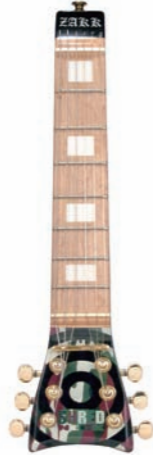
Zakk Wylde Camouflage ¥9,975