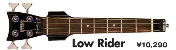
Low Rider ¥10,290

ベース仕様です。弦も太いです。ベグも大きいです。間違いなくベースです。そして、写真を見てもらうとわかるとおり、耳みたいなのが付いている。これが、ベース・モデル専用のフィンガーレストで、指弾き用に親指を乗せるパーツを付けてくれているみたいです。たしかに、違和感なく練習できるな……。でも、チューニングできないから違和感はあるか……。