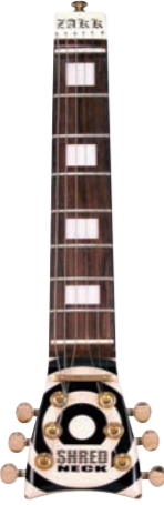
Zakk Wylde Bull's-Eye ¥9,975