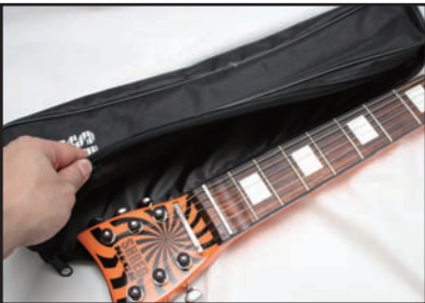
↑なんと、専用ケースまで付属している。これは、練習用アイテムというより、もはやフィギュアだ!